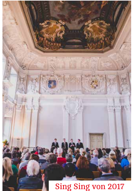
Sing Sing von 2017